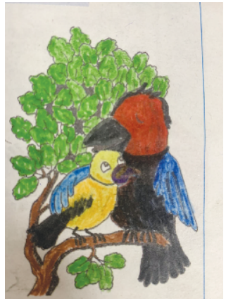
小记者：张凯泽 证号：222978 周口韩庄小学一（3）班