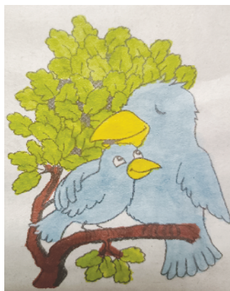
小记者：王铄 证号：220707 周口闫庄小学二（4）班