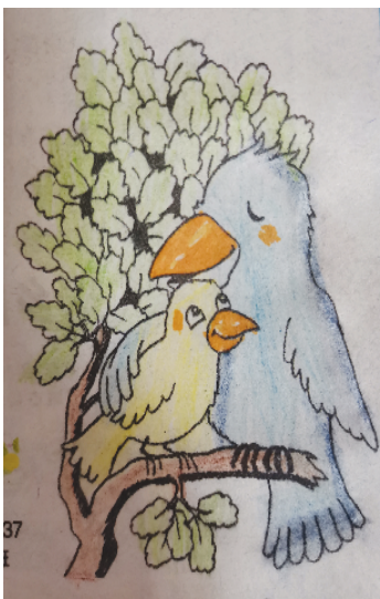
小记者：靳舒宇 证号：222949 周口韩庄小学一（1）班

作品涂好后，可用相机或者手机将其拍下来，发至zkwbxjz@126.com，写清姓名、编号、学校班级。请注意图片格式（JPG格式）和清晰度，本报将选取较好的作品在下期《小记者报》和小记者微信平台集中展示。