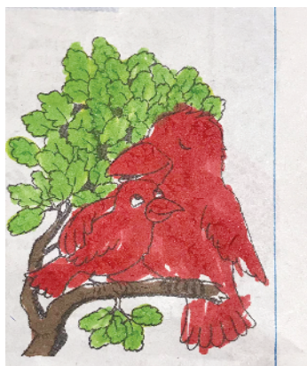
小记者：叶子茵 证号：220698 周口闫庄小学二（2）班