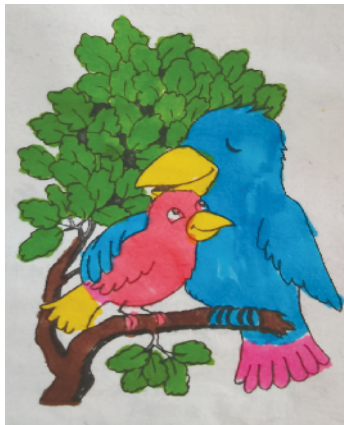
小记者：赵翊彤 证号：223160 周口榆树园小学二（1）班