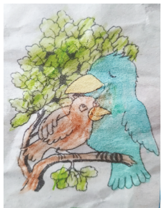
小记者：张孟泽 证号：222333 周口经开区一小四（1）班