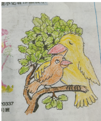
小记者：张若心 证号：220357 周口纺织路小学一（6）班