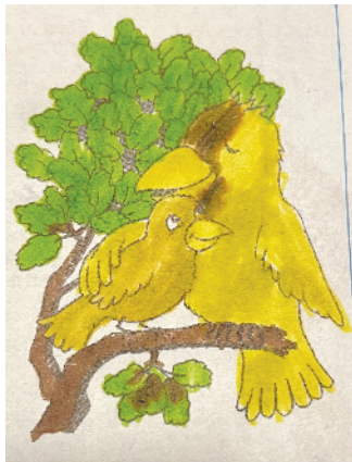
小记者：梁卓雅 证号：222943 周口韩庄小学一（1）班