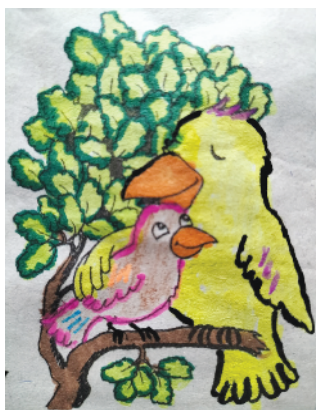
小记者：史若轩 证号：221250 周口六一路小学二（5）班