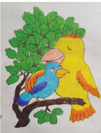
小记者：谢俊树 证号：220691 周口闫庄小学一（8）班