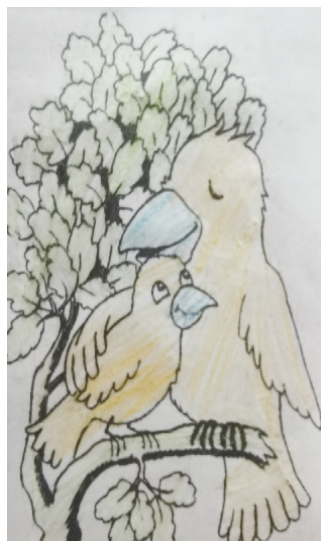
小记者：蔡佳奕 证号：221290 周口六一路小学三（3）班