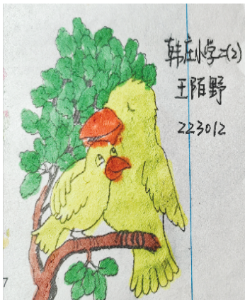
小记者：王陌野 证号：223012 周口韩庄小学二（2）班