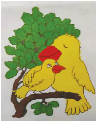
小记者：杨梓浩 证号：220733 周口闫庄小学二（8）班