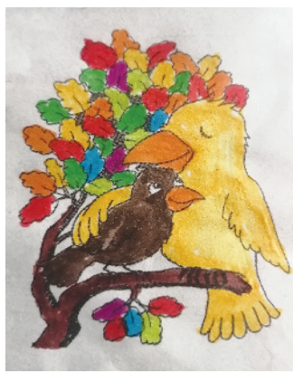
小记者：郭铭坤 证号：223207 周口榆树园小学三（1）班