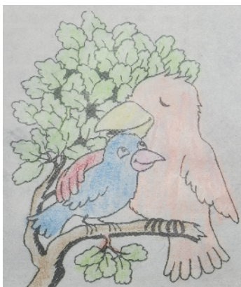
小记者：张徐诺 证号：222945 周口韩庄小学一（1）班