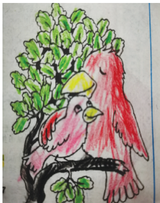
小记者：杨晓然 证号：222255 周口经开区一小一（5）班